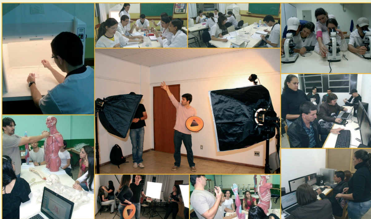
Nas fotos do mosaico, aulas práticas nos laboratórios de Física/Química, de Anatomia e de Publicidade e Propaganda

Em termos de consolidações, é possível avaliar a FDV por vários ângulos, mas um resumo bem a principal meta de toda instituição de ensino superior: ver seus egressos inseridos no mercado de trabalho. Em dez anos foram mais de mil estudantes graduados nos três primeiros cursos iniciais da faculdade - Administração, Sistemas de Informação e Pedagogia. Eles são reconhecidos em Viçosa e em diversas cidades do país como profissionais competentes, formados no dia-a-dia de um ambiente acadêmico marcado pela harmonia, companheirismo e pela aprendizagem da convivência, característica