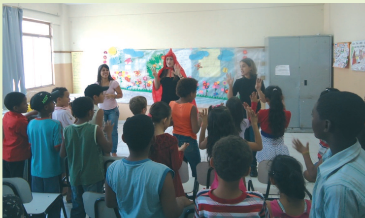
Alunos dos cursos de Pedagogia e Educação Física realizaram várias atividades com as crianças do Laranjal