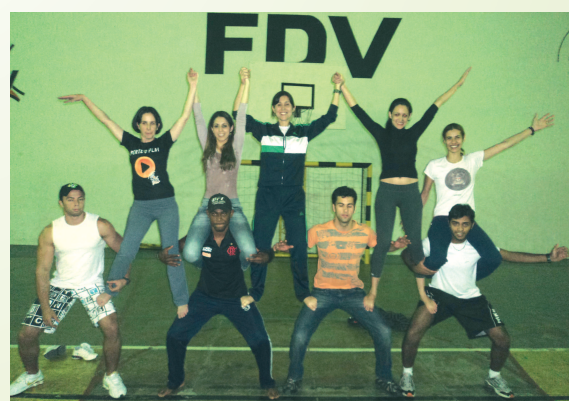
Flagrante de uma aula de Ginástica Acrobática

O objetivo da disciplina é desenvolver competências para descrever a execução técnica dos exercícios característicos de Ginástica Geral e Ginástica Acrobática, assim como elaborar preparação, treinamento e sequências coreográficas. Apresentar métodos pedagógicos para o ensino-aprendizagem dos fundamentos